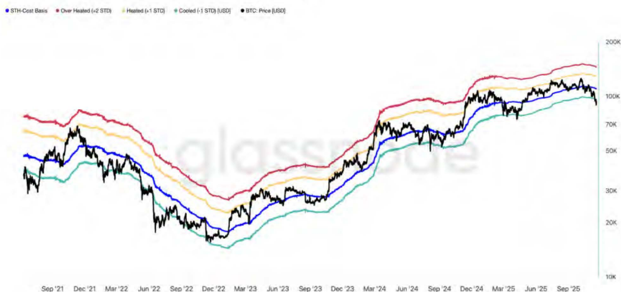
Risk Indicator: Short-Term Holder Cost Basis Model

نقاط ۹۵ تا ۹۷ هزار دلار اکنون تبدیل به منطقه‌ی تعیین‌کننده شده‌اند؛ بالا رفتن قیمت از آن‌ها اولین نشانه‌ی بهبود است.